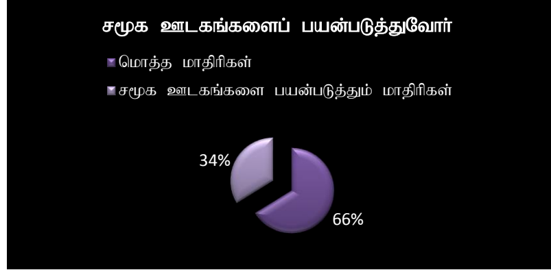
வரைபு 5.1 சமூக ஊடகங்களைப் பயன்படுத்துவோர்

இவ்வகையில் ஆய்வுக்காகத் தெரிவு செய்யப்பட்ட மொத்த 45 மாதிரிகளுள் 23 மாணவர்கள் சமூக ஊடகங்களைப் பயன்படுத்துகின்றனர். இதனை வரைபு 5.1இன் மூலம் அறிய முடியும்.